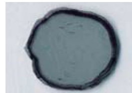
オープン 70℃×1時間加熱後 ヒートサイクル試験* 25サイクル Oven-heated to 70 °C for 1h + 25cycles

当社シリコンPCM(25サイクル後) Shin-Etsu PCM(after 25cycles)